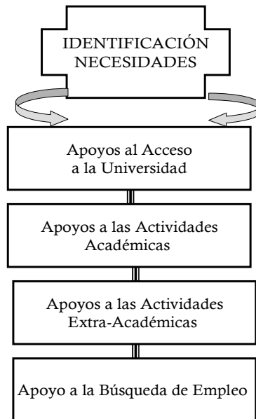
Figura 1: Actividades para las que requieren más apoyo los estudiantes con SA/AAF.

La provisión de apoyos a estudiantes universitarios con SA/AAF en estos cuatro procesos y actividades, tal como se detallará a continuación en el presente Modelo de Apoyos , requiere: